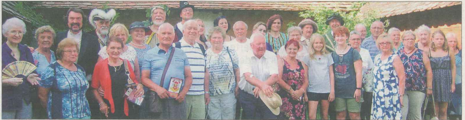
WILDUNGSMAUER | Der Pensionistenverband Wildungsmauer besuchte das Romantiktheater in Untermarkersdorf (Waldviertel), um sich eine Zauber-show und die Operette „Der himmlische Bacchus“ anzusehen. Der Ausklang fand beim Heurigen statt.