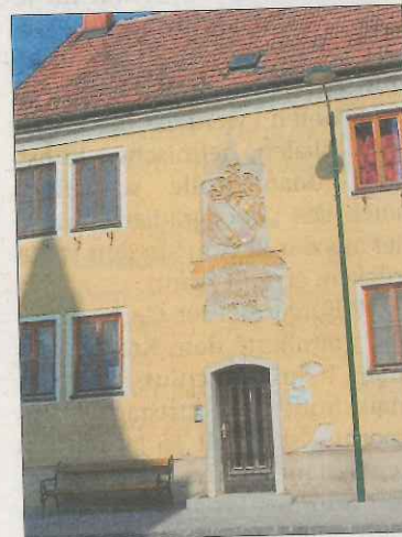
Das Haus in der Hauptstraße 20 sieht von außen recht renovierungsbedürftig aus. Auch im Inneren müsste laut Bürgermeister Wimmer einiges getan werden.

Mit den Psychologinnen müsste man noch eine Lösung finden. „Das wird aber kein Problem sein“, ist VP-Bürgermeister